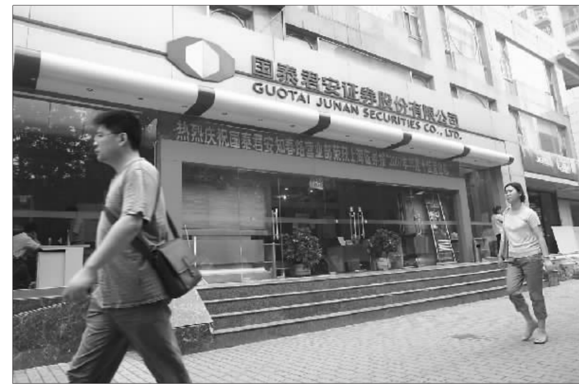
国泰君安今年上半年赚钱最多,获得46.46亿元净利润

●本报记者 张雪 继部分中小券商披露半年报后,昨日国泰君安、广发证券、申银万国、华泰证券、光大证券等一批大型券商的中期业绩也亮相于银行间市场。