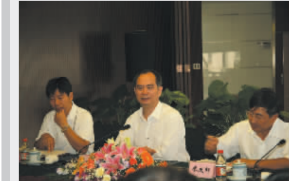
国家六部委来所评审(央企平台)