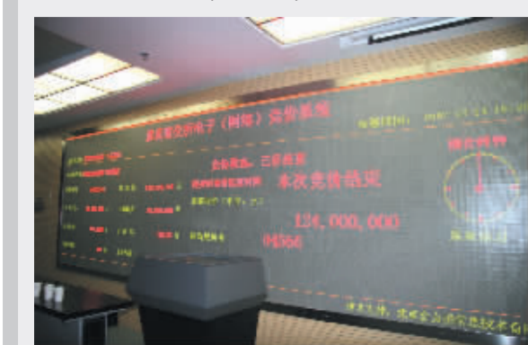
东莞CDC转让项目电子竞价