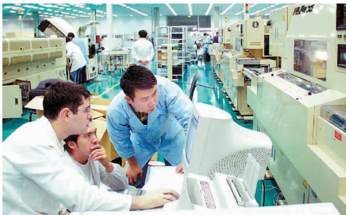
外资企业在中国经营,既为中国经济发展做出了贡献,也为企业自身发展壮大及其所在国的发展带来利益 资料图

商务部部长助理王超24日表示,我国出台一系列涉及外资的政策调整,是为了给在中国经营的企业提供更加公平、开放和规范的环境,并有助于引导外资企业更好地适应中国经济发展的需要。