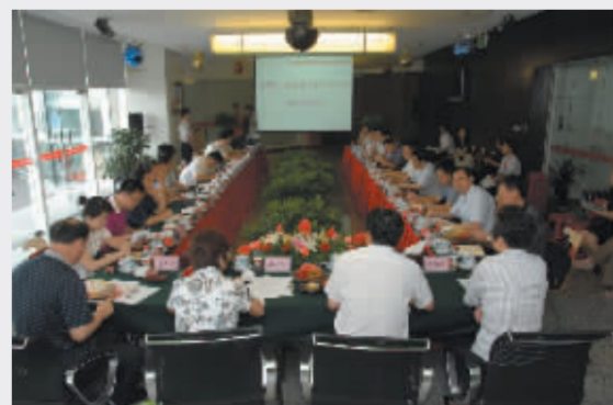
国家金融调研组来所调研