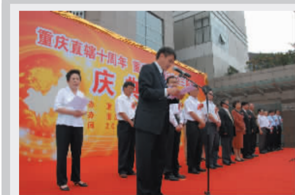
国务院国资委授予重交所为中央企业国有产权交易试点机构