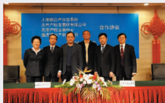
京、津、沪、渝产交所携手合作