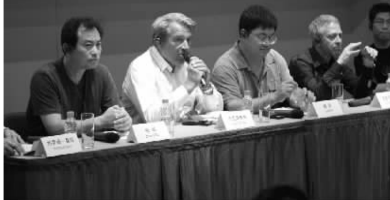
尤伦斯当代艺术中心收藏家高峰论坛

述了他们收藏中国当代艺术的经历和观点,同时还共同讨论了由新一代收藏家开始的,通过创办公益艺术机构支持艺术发展的新模式,将在当代文化中发挥怎样的作用?收藏中国艺术品的经历中将遇到怎样的问题和挑战?如何建立与艺术家的关系?中国艺术品收藏有什么样的变化等诸多与中国当代艺术发展息息相关的问题。