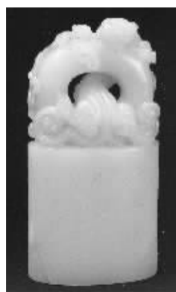
《杨玉璇制将军洞白芙蓉螭钮章》

印章专家袁慧敏指出,“三美合一”为印章收藏首选,即印材优、雕工精、篆刻好,这类印章集文化、艺术和实用价值于一身,是市场绝对的宠物和价格标杆。如此次春拍状元《田黄冻双凤钮闲章》,重达257克,采用“石中之王”的田黄冻为材,加之印钮雕工精美,印文又取唐太宗贤妃徐惠《奉和御制小山赋》中的名句“奉天眷于千龄”,所以极为稀有,乃“三美合一”的典型例证,也是受买家喜爱并以431.2万成交的重要原因。另一方《杨玉璇制将军洞白芙蓉螭钮章》也属此类,寿山石雕刻鼻祖杨玉璇的雕工加上白芙蓉如此高雅贵重的石料,又有“我与梅花有旧盟”这样清雅且赋予情趣的印文,最终以33.6万的价格成交。