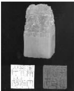
《田黄冻双凤钮闲章》

过去,对于印章本身的材质、印钮雕刻、印文篆刻以及“方寸之地”融各类艺术形式于一身的文化艺术价值的认可自在话下,但这种认知只是局限于一些专业人士圈子里。自从“中国印”成为北京奥运会徽以来,民间认知度和接受度就在逐渐扩大和提升,一股印章收藏热正滚滚袭来。因此,往日只被视为书画的点缀和配角的印章一下子被推至台前,成为众人瞩目的焦点。