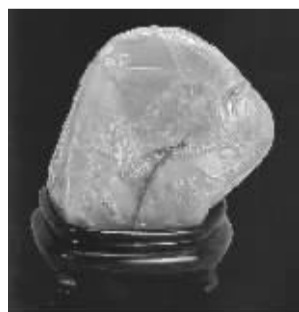
《林文举作乌鸦皮田黄“夜宴桃李园”薄意随形印章》

此外,名家雕工也是买家较为看中的一个方面。如康熙时期的寿山石鼻祖杨玉璇的作品就是典型代表,他首创巧色雕刻,善制人物、兽钮,力求造型古朴典雅,形神兼备,尤以观音最著,被誉为“鬼斧神工”,后世寿山石雕无人能出其右,而且其作品传世极少,所以市场如出现其作品,必当弥足珍贵。而现代薄意艺术大师林清卿的作品在这次春拍就备受关注,如一对《林清卿作尼姑楼喜鹊登梅薄意印石》在上海嘉泰以1.8万起拍,最后落槌12.32万,价格翻了近10倍。而西冷篆刻专场推出的一对《林清卿雕薄意花并民国二高山印章》则是12万元起拍,成交17.92万,可见市场喜爱程度。而另一位当代已故寿山石雕刻大师林寿焜的作品也颇受藏家欢迎,以302.4万在上海嘉泰成交的《林寿焜刻黄金田黄“桃源洞天”薄意方章》,造工构图精妙,刀法清爽流畅,就是林寿焜的精品。另外阮文钊、郭祥德、郭石脚、林文举等大师作品也都值得关注和收藏。