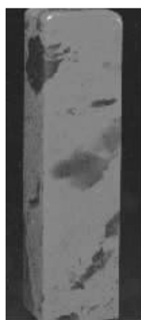
《昌化大红袍鸡血冻石》