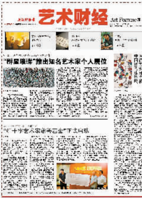
详见今日《艺术财经》

世贸组织30多个主要成员21日开始在日内瓦举行部长级磋商,试图为年内完成多哈回合谈判作关键一搏,但前4天的会议并没有在农业和非农产品市场准入等核心问题上取得任何突破。按照计划,有关各方力争在25日完成谈判并形成文字以提交26日的成员会议审议通过。