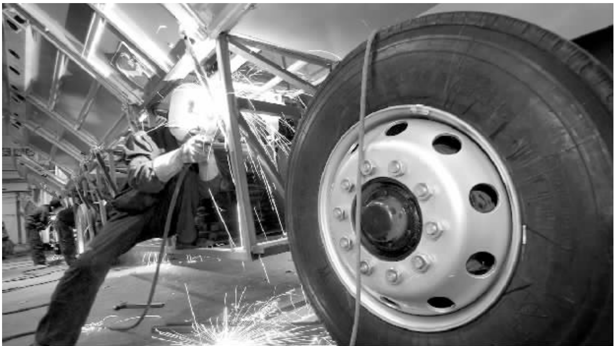
前5个月,工业企业实现利润10944亿元,增加1893亿元,增长20.9% 资料图

持续上涨,同比涨幅加速攀升,不断创出历史新高。其中,6月当月环比上涨2.5%,同比上涨25.3%。上半年,工业品出厂价格同比上涨7.6%(6月当月上涨8.8%),涨幅同比提高4.8个百分点;原材料、燃料、动力价格上涨11.1%(6月当月上涨13.5%),提高7.3个百分点。同时,上半年发生的重大自然灾害和外部需求减缓等不利因素,确实对工业经济造成了负面影响。上半年,轻重工业增速均有所放缓。其中,轻、重工业增加值同比分别增长13.8%和17.3%,增速同比减缓2.6和2.2个百分点。上半年,工业产品出口增幅回落。工业出口交货值38334亿元,同比增长17%,增速同比减缓4.7个百分点。