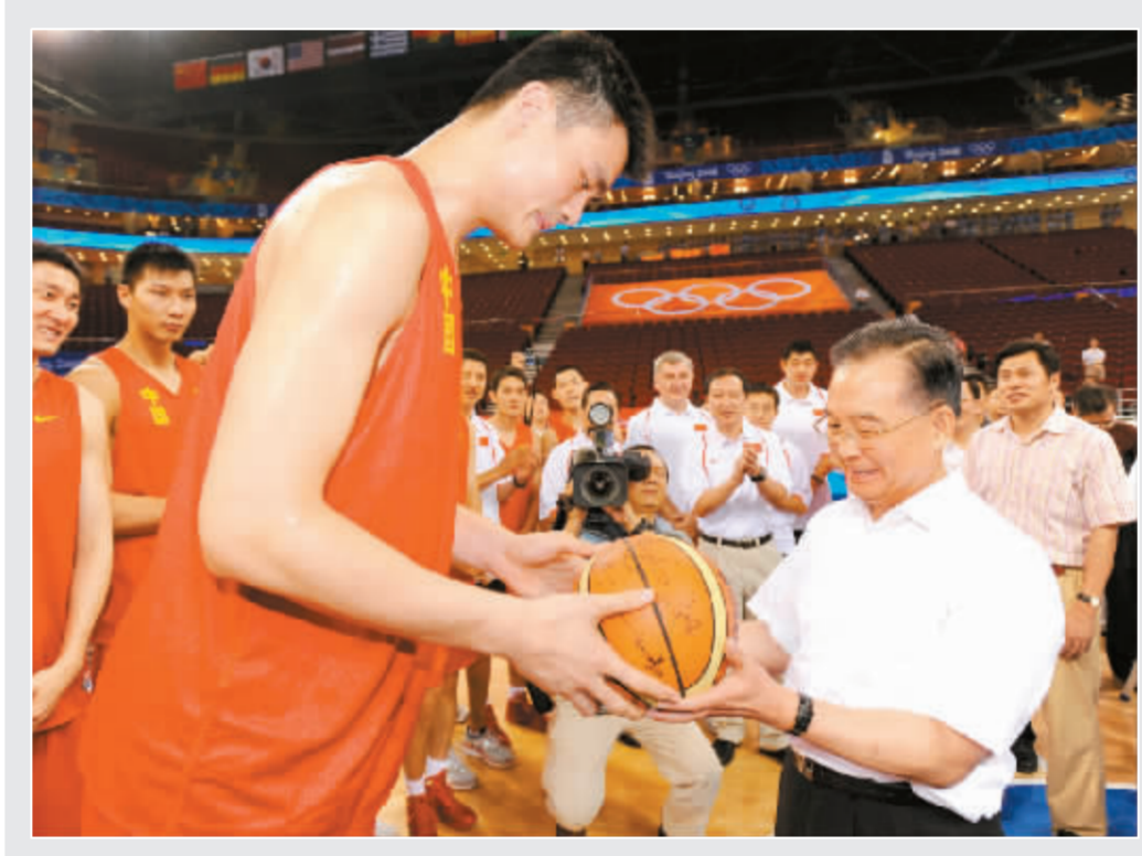
温家宝考察奥运场馆和保障设施

相关新闻: 上交所拟引投资者准入制 深交所将规范重大重组 投资者保护状况将评估 详见封二