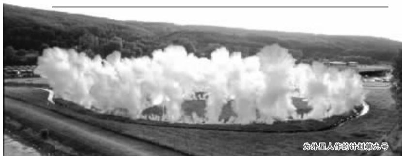
为外星人作的计划第九号

以蔡国强引领的这一单元的市场在内地也逐渐具有了相对广泛的支持力和稳定性，作品价格正处于持续攀升的状态，涨幅较大，值得收藏投资人对其进行进一步的关注