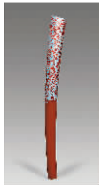
2008北京奥运火炬受到买家追捧

苏富比的这次亚洲艺术秋季系列拍卖会,将连续4天举办不同专题的拍卖,其中还包括9月18日举办的印度以及巴基斯坦的现当代南亚艺术拍卖会,9月19日举办的印度和东南亚艺术作品拍卖会。