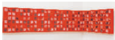
洪绍裴 折画面系列

9月6日，台湾艺术家《折·叠》洪绍裴个展在北京现在画廊上海空间开幕。作为年轻的艺术家的洪绍裴执着于探索绘画语言本身，打破架上艺术平面二元的表现形式向我们展示另一种“绘画可能性”。他借助丙烯颜料独特的延展性与韧性，用近乎虔诚般专注与耐性反复实验将液态颜料固化、堆积、折叠，在画布上“雕刻”绘画创作出不可思议的架上立体世界。艺术家试图创作出一种能同时沟通技术、美学、观念的绘画风格，带给我们关于当代绘画的新体验。