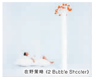
在野策略 (2 Bubble Shccter)

金会的支持于9月7日开幕，并将持续至9月24日结束。来自越南和柬埔寨地区不同年龄和时代背景的十多位艺术家参加了此次展览。展览将通过大量的艺术作品反映出柬埔寨、越南当代文化艺术现状，使观众抛弃固有的狭隘，能更广泛地了解并认识东南亚地域的发展状况。