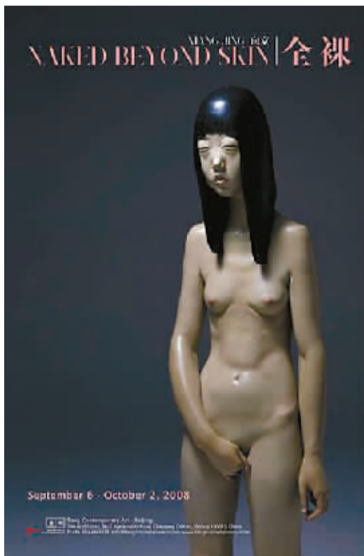
September 6 - October 2, 2008

2005年《你的身体》，可视为向京在雕塑领域中确立自己独特而强烈语言的代表作，是“女性身体”这一主题的开始；时隔三年，向京重拾这一主题，并用一个个展览试图结束此主题——她宣称“女性身体告一段落”。知名评论家朱朱说：“经过无数次的流产与分娩之后，向京有意要结束她关于‘女性身体’的阶段性工作。在这个时机介入到对她的评论之中，就像游历到一座即将宣告其独立的女儿国，脚手架还没有完全撤除，但庆典的氛围已经在。”凯伦·史密斯如此评论：“就像她的雕塑作品一样，向京也是从一个女孩成长为一个女人，她现在也面对着一个所有表情都不过反映了外在经验的世界。她在这里也提出了一个重要的问题：人物雕塑，甚至是女性身体作为一种艺术形式，今天能否还具有深刻的意义，并引发人深思，从而经久不衰呢？它们也许是美的对立面，但是在她的雕塑作品中以令人极度不安的方式呈现的女性身体当中，向京也许找到了答案。”