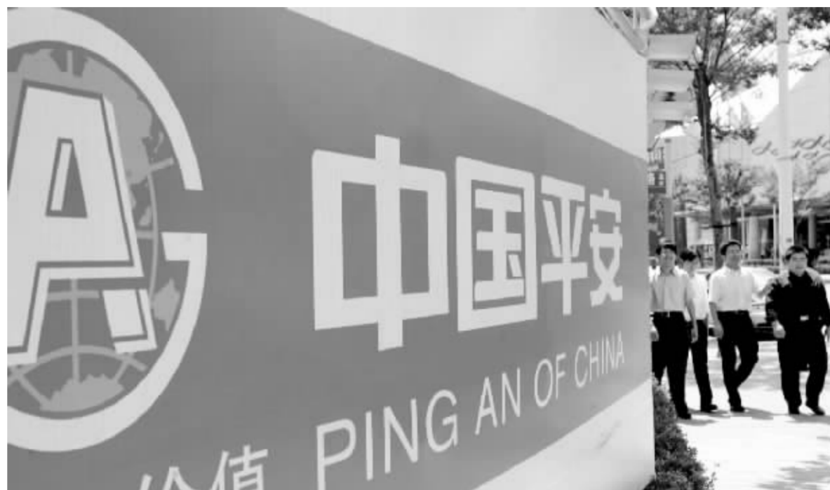
8月机构尤其偏爱中国平安 资料图

8月,机构整体的口味主要是围绕金融类、煤炭石油类以及各行业的龙头股。颇受机构偏爱的保险股自8月1日起至27日间,整体上涨6.1%,机构资金净流入48.8亿元,中国平安被重点持有。从大智慧Topview数据来看,机构对保险股的资金净流入占据了整个银行板块的一半还多。仅中国平安,同期机构净买入就达33.3亿元,其