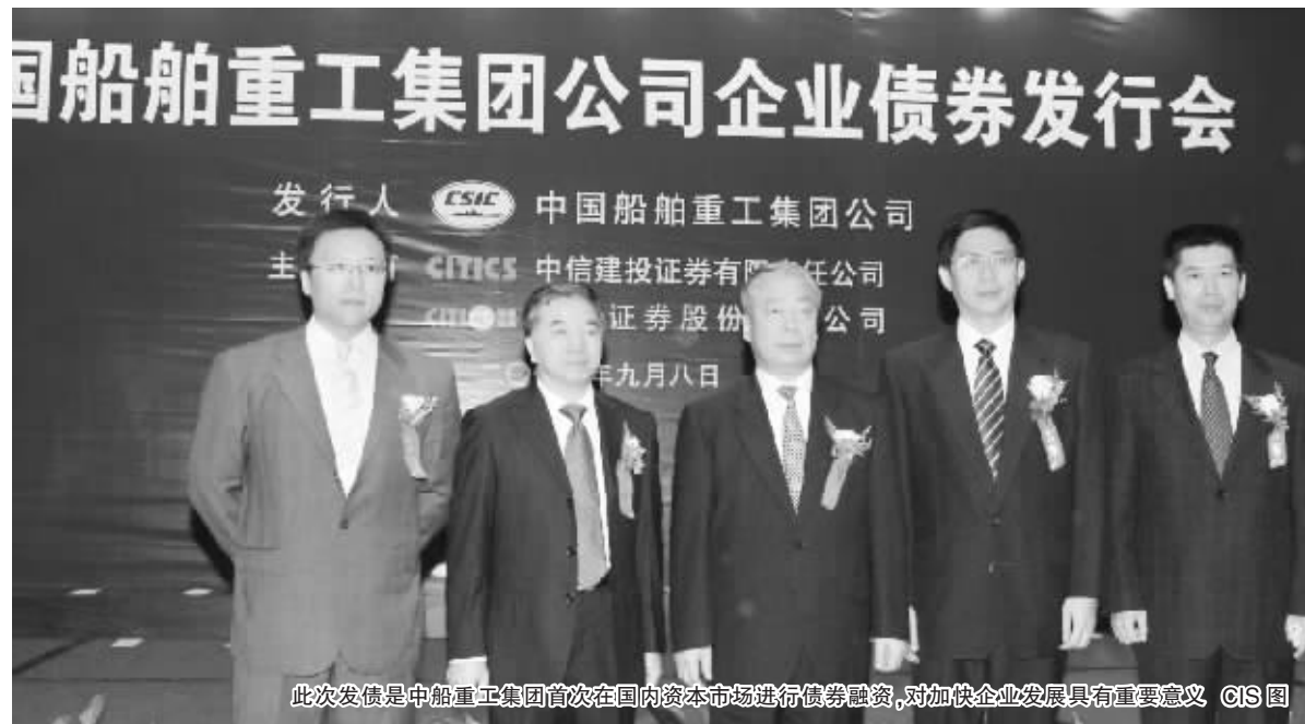
此次发债是中船重工集团首次在国内资本市场进行债券融资,对加快企业发展具有重要意义