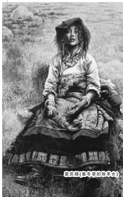
袁庆禄《备冬草的牧羊女》

件绘画和雕塑作品。此次展览参与承办的还有美国阿肯色州温泉城艺术中心和美国徐氏画廊。上个世纪80年代末就旅居美国,且出生于上海的徐氏画廊负责人徐龙华也以艺术家的名义参与了这次与故乡合作的中美艺术家联展,带来了自己十几件人体写生、肖像和风景油画作品,其大型雕塑作品《母亲与自然》在1992年在美国国家公园落成揭幕时,获得美国总统比尔·克林顿的亲笔贺信。(杨琳)