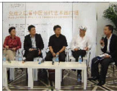
艺术品投资沙龙现场