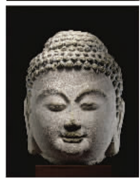
来自中国山西天龙山石窟第10洞北齐时期的佛头