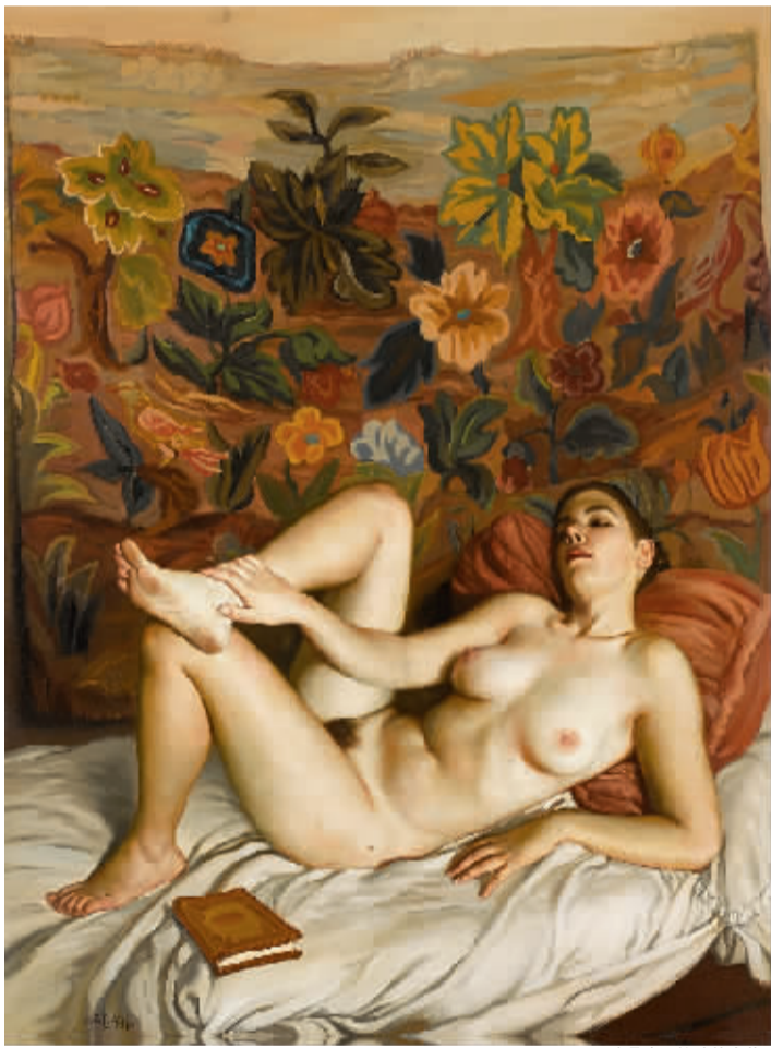
陈丹青《躺卧的人体》

洪平涛在拍卖会结束后接受记者采访时表示,他最关心三张“大作品”,结果是陈丹青、陈钧德的作品成交,王广义的流拍。他总结道,这次拍卖,高价位的、被炒作的拍品成交不好,尤其是当代艺术,没有买家。如何森1993年作的《铜鸟》,估价150万到200万元;郭晋1993年作的《秋千者》,估价80万到99万元;王广义1989年作的《后古典——莫娜丽莎之后·变体1号》,估价800万到1200万元,都没有成交。相形之下,传统的作品、中低价位的作品成交尚好,而好的高价作品,如陈丹青1991年的《躺卧的人体》,仍以515.2万元高价成交;陈钧德1978年作的《上海的早晨》,也以504万元的高价成交。不过他透露,当代艺术虽然遇冷,但还是有人愿意以最低估价的8折收购王广义和何森的那两幅作品,而卖家不愿意降价脱手。显然,人们对当代艺术的行情还有种种期盼。