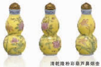
清乾隆粉彩葫芦鼻烟壶

从纽约苏富比秋拍的“亚洲当代艺术”专场来看,中国当代艺术的遇冷一方面是由于春季拍卖的下跌苗头使得拍卖行在征集作品上遇到困难,另一方面纽约金融市场动荡的影响也使买家多处于观望态度,因此导致了专场中不仅拍卖价格下降,而且流拍的作品数量亦增多。从春季市场的经验来看,中国当代艺术在纽约市场的遇冷更多地取决于环境因素,并不会过多地影响到国内当代艺术的拍卖市场,至于秋季拍卖在国内的市场境遇如何,接下来即将上演的国内秋拍大戏则更加值得关注。