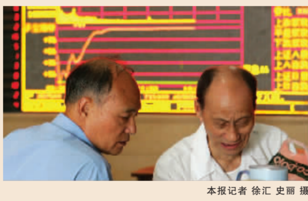
本报记者 徐汇 史丽 摄