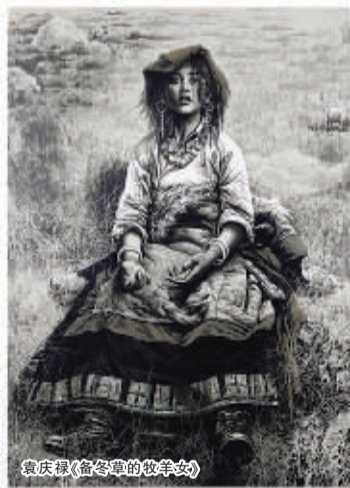
袁庆禄《备冬的牧羊女》

令他欣慰的是,在这次版画精品展会上,由著名版画艺术家应天齐先生所做的“复制版画缘何成为原创版画?”的讲座受到了所有画廊业主、机构主和藏家的称赞,都表示通过这次讲座收益匪浅。通过该讲座,大家对于复制版画和原创版画的观念有了比较清晰的认识。