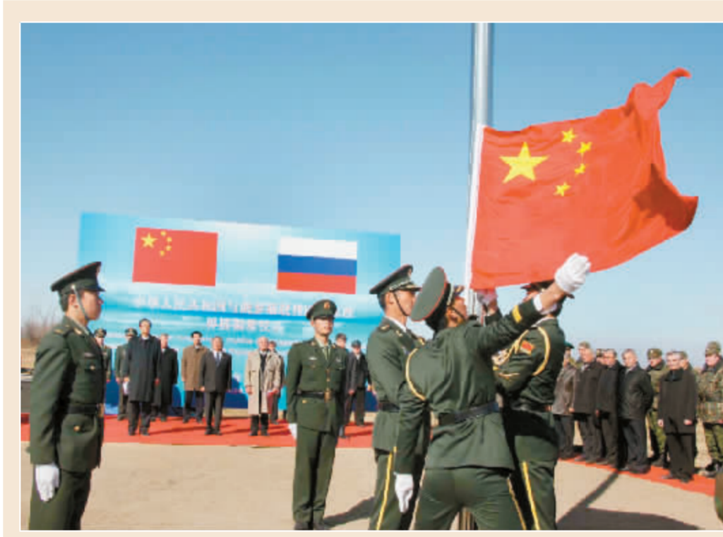
国旗升上黑瞎子岛

10月14日,中俄界桩揭幕仪式上升起中华人民共和国国旗。当日,中俄双方在黑瞎子岛举行中华人民共和国与俄罗斯联邦国界东段界桩揭幕仪式。两国边防部队已开始按双方勘定的国界线履行防务。 新华社图