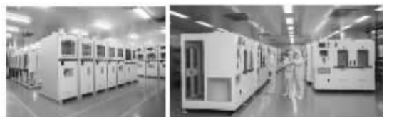
图 1 高纯工艺系统

1. 高纯工艺系统 半导体工艺中多种特殊制程,会使用到大量超纯级(ppb级别)的干法工艺系统,这是完成工艺制程的关键环节,其特点是高纯并耐腐蚀。在集成电路领域,高纯工艺系统包括高纯蚀刻系统、大宗气系统、湿法氧化系统、湿法清洗及反应系统、前驱体工艺系统等。