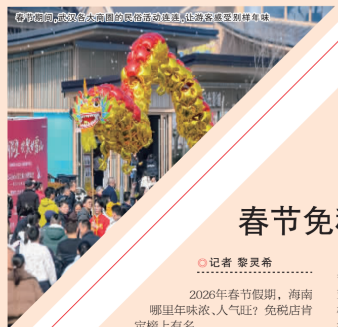
春节期间，武汉各大商圈的民俗活动连连，让游客感受别样年味

1月24日起，湖北面向在鄂消费者发放近6亿元消费补贴，共计带动吃喝玩乐消费31.55亿元。湖北省商务厅相关负责人表示，将不断扩大优质商品和服务供给，培育打造更多沉浸式、体验式消费新场景，营造红红火火、热热闹闹的节日消费氛围，充分激发人民群众的消费活力。