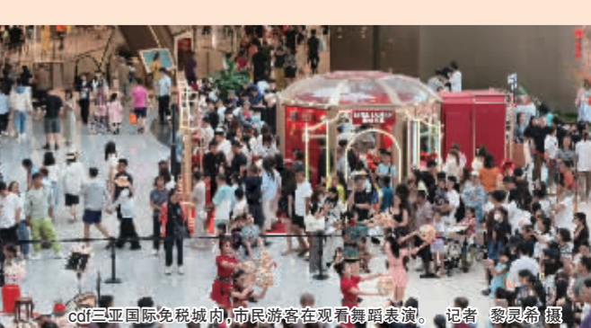
cdf三亚国际免税城，市民游客在观看舞狮表演。

据三亚市商务局披露的数据，2月17日至22日，三亚全市免税店销售额连续6天单日突破2亿元。其中，2月22日（正月初六），全市四家离岛免税店销售总额达2.29亿元，同比2025年大年初六增长11.4%。另据海口海关统计，春节假期前五天（2月15日至19日），海南离岛免税购物金额达13.8亿元，购物人数17.7万人次，比去年春节假期前五天分别增长19%和24.6%。