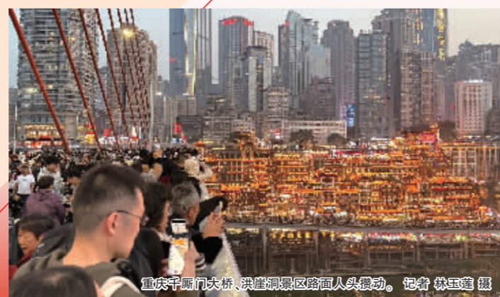
重庆千厮门大桥，共庆新春佳节。

此外，为全方位激活春节文旅消费市场，重庆推出四大惠民措施，包括开展消费让利活动、发放惠民消费券等。成都则推出省、市、区三级消费券与3亿元有奖发票等政策，撬动春节消费热潮。