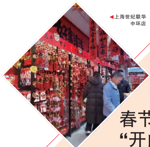
上海世纪联华中环店

春节假期期间，上海各大商圈深度融合资源，营造“百马迎新”浓厚氛围，文旅旅展活动轮番上演，吸引来的强劲人气有效转化为高涨的消费热情。数据显示，春节假期期间，上海市商务委监测的19个市级商圈消费金额47.8亿元，同比增长12.0%；日均客流319万人次，同比增长15.8%。