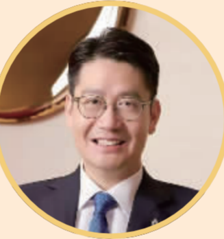
全国政协社会和法制委员会副主任、东亚银行联席行政总裁 李民斌

张奎介绍,推进落地“跨境理财通”,并持续提升试点业务便利性,优化投资者门槛和产品范围。截至2025年末,粤港澳三地有17.8万人参与“跨境理财通”试点,资金汇划1313亿元。广东率先在横琴粤澳深度合作区开展多功能自由贸易账户体系试点,探索资本项目高水平对外开放,为粤澳合作区经营主体金融服务需求提供有效支持。截至2025年末,试点银行累计开立账户693个,办理资金业务4419亿元。