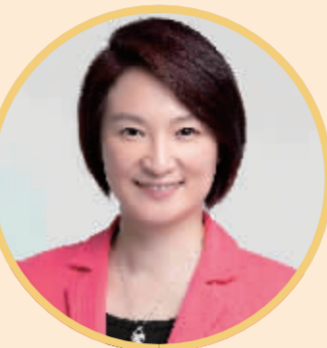
全国人大常委会委员、香港特别行政区立法会主席 李慧琼

关于聚力打造粤港澳大湾区全球人才高地,李慧琼建议,建立专业人才购房资金通道,为留住人才提供支持。参考金融市场的“互联互通”机制,为来港定居的内地人才提供特别的购房渠道,允许符合资格的内地人才以闭环形式,在港购置物业,解决居住问题。此外,她还建议,依托大湾区产业优势,建设全球首条跨境常态化低空航线。采取“先货后客”模式,将跨境货运时间压缩至30分钟内,打造行业标杆。