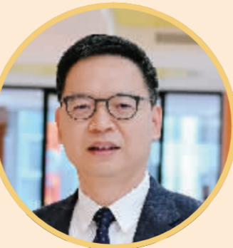
全国政协委员、中豪律师事务所管委会主席 袁小彬

面对新挑战,袁小彬建议,相关监管部门主动对接国际高标准金融监管规则,在绿色金融标准、数字金融监管等领域积极参与国际规则制定,提升我国在国际金融治理中的话语权和影响力。同时,进一步提升人民币跨境支付系统(CIPS)的服务能力和国际参与度,完善跨境金融风险监测、识别和处置体系,建立与国际规则接轨的跨境纠纷争端解决机制,构建与高水平对外开放相适应的跨境金融监管体系,有效防范化解跨境金融风险。