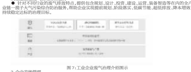
图7:工业企业废气治理流程图