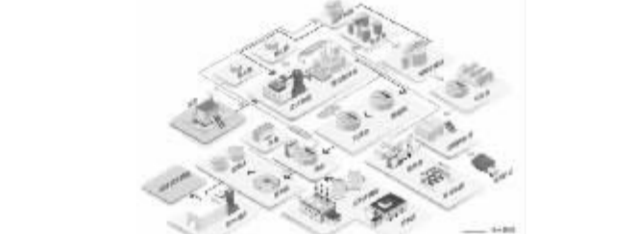
图2:污水处理工艺流程图