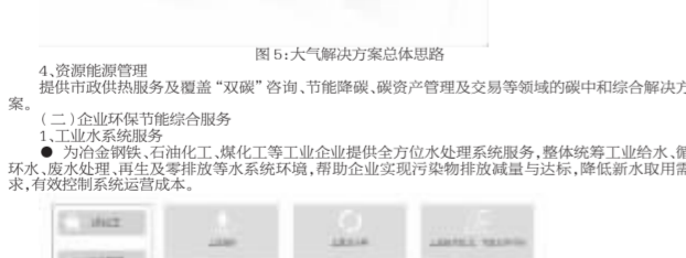
图6:工业水服务流程图