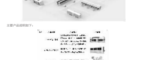
主要产品说明如下:

根据临床医嘱自动分批次,提高医院整体药物调配效率,优化业务流程,降低药师劳动强度,确保配药质量精准,保障患者用药安全,有效控制药师中心工作量和药师工作强度,降低配药差错,减少浪费,提高效率。