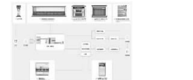
主要产品说明如下:

智慧“急诊药房” 利用“信息化+自动化”两化融合技术,基于大数据分析、设备协同调度,实现“自动库存+自动加药+自动发药”,建立了急诊药房快速一体化整体解决方案。 1.急诊药房整体解决方案系列产品采用“库发一体”等模式,通过智能设备优化了传统药房的工作模式,具体体现在以下几个方面: “库发一体”智慧药房整体解决方案,被工信部认定为国内领先水平,可实现药品自动化入库、自动化补充、自动化存盘、盘点和发药,所有药品数据皆由自动化设备和信息化系统解决;从医院药房(或者商业公司配送)到全自动化智慧药房,再到药房窗口,最终到患者手中,可全程跟踪管控药品,真正实现药品在院内流通的“全流程”闭环管理模式;同时,可以有效提高处方及医嘱处理效率,减少患者在门诊急诊药房窗口的滞留时间,降低医护人员排班,拥堵导致的潜在交叉感染几率;整套系统通过分析门诊/急诊药房历史数据,针对项目方案进行个性化定制,对药品的存储、管理、分发等流程进行智能化升级,对药品的精准准备进行准确分析,从而提升急诊药房的药品使用效率,保障用药安全,促进合理用药。