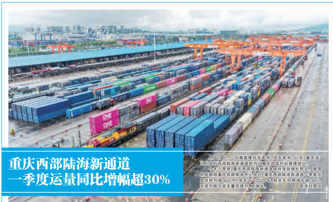
重庆西部陆海新通道 一季度运量同比增幅超30%

数据显示,2025年,服务业增加值首次突破80万亿元。今年一季度,服务业增加值占GDP比重为61.7%,比上年同期提高0.4个百分点,对经济增长贡献率达到63.2%。