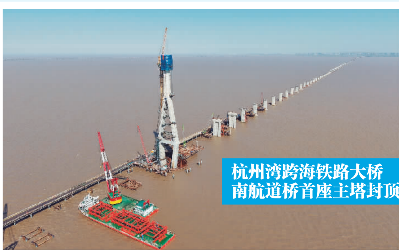
杭州湾跨海铁路大桥 南航道桥首座主塔封顶

本次合并重组被视为继国泰海通之后，上海国资券商优化布局的又一重要举措。它不仅是国资国企改革深化的“破题之举”，通过资源优化配置，打造一家资本实力强、业务均衡、抗风险能力更强的上市券商，更是落实国家战略、服务上海国际金融中心建设与长三角一体化发展的关键载体。未来，重组后的东方证券将在服务实体经济、优化资源配置、防控金融风险中发挥更重要的作用，助力上海加快建设具有全球竞争力的国际金融中心。